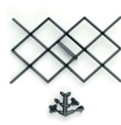
Patchwork Cutter Motif Losange