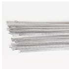
Culpitt Floral Wire Argent 24 Gauge set/50