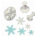
PME Emporte-pièce Pousoir Flocon de Neige set/3