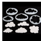
FMM Emporte-pièce Nuage