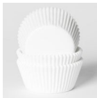
House of Marie Baking Cups Blanc pk/48