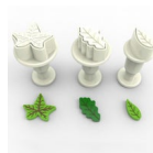
Dekofee Découpoirs Éjecteurs Mini Feuilles set/3