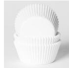
House of Marie Baking Cups Blanc pk/48