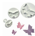
PME Emporte-pièce Poussoir Papillon set/3